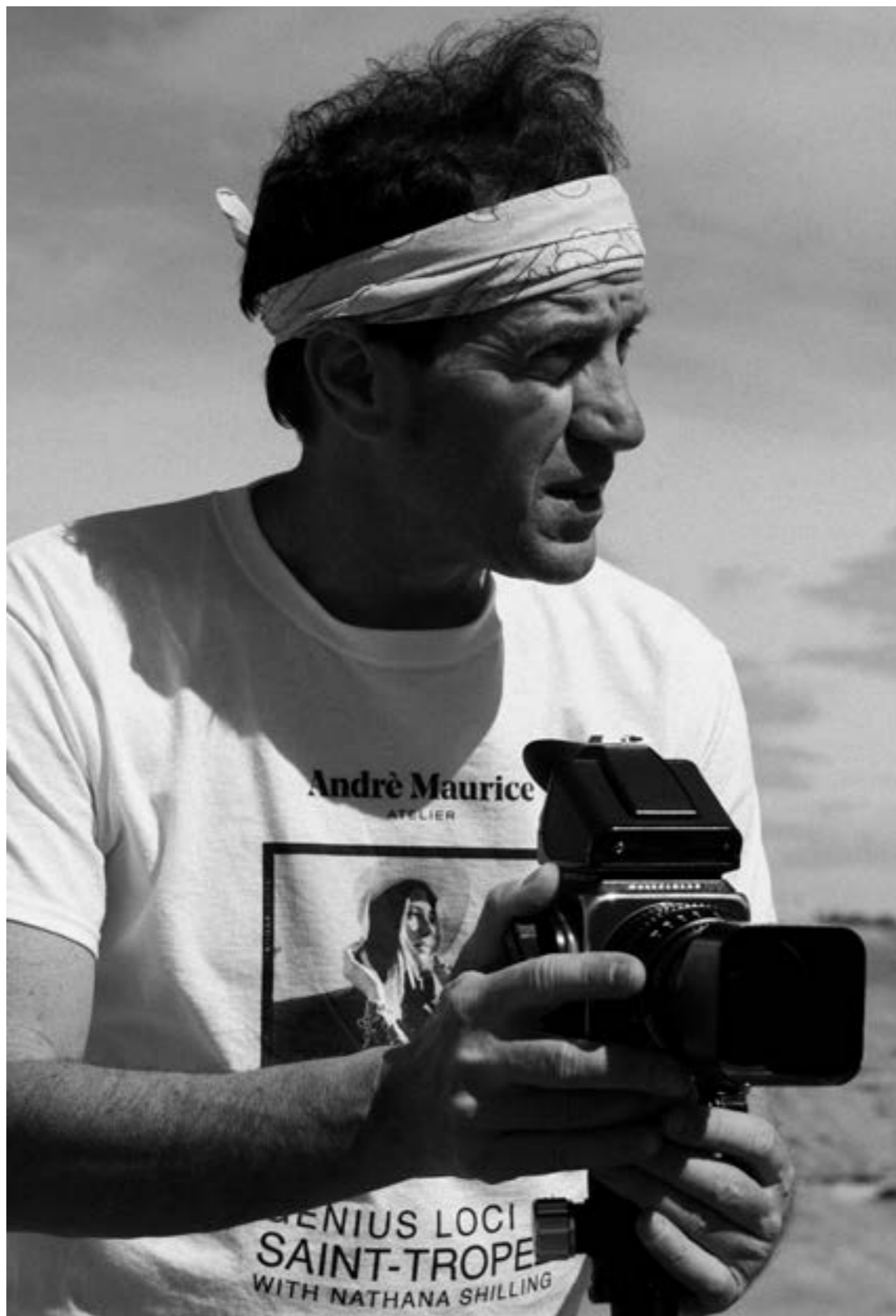
Agafay 2024